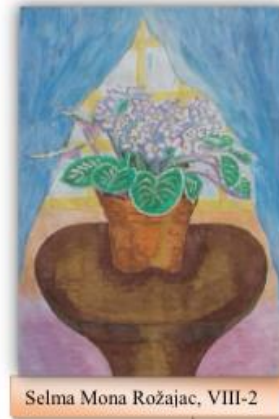
Selma Mona Rožajac, VIII-2