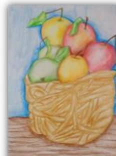
Adela Husejnović, VI-4