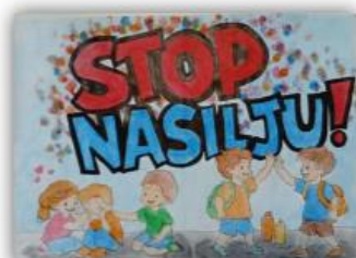
Dejan Buljandrić, VIII-4