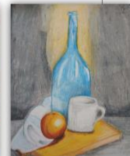
Amila Kadrić, VIII-6