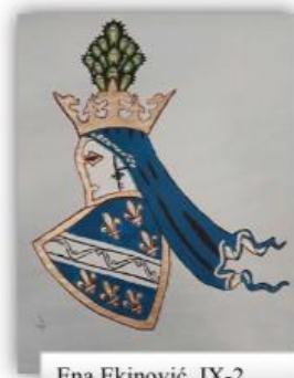
Ena Ekinović, IX-2