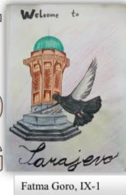
Fatma Goro, IX-1