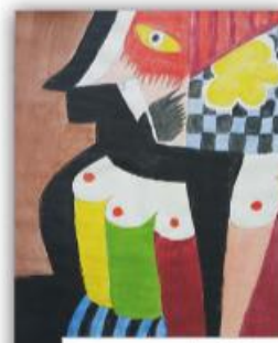
Amna Durak, IX-1