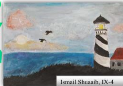
Ismail Shuaab, IX-4