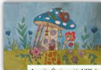
Lamija Čerimović, VIII-6