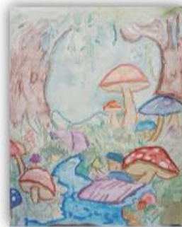
Aja Šeta, VIII-2