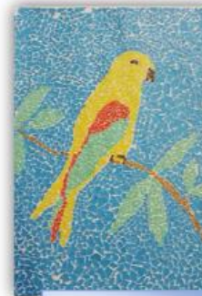
Faris Atić, VII-2