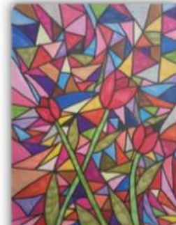
Esmina Varaga, IX-3