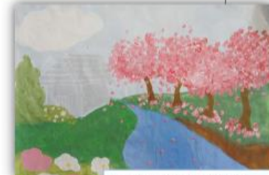
Lamija Bijelić, VIII-1