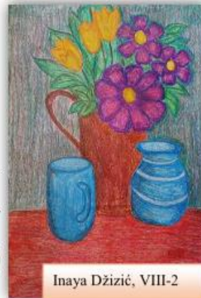
Inaya Džizić, VIII-2