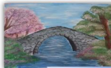
Ilma Softić, VI-1