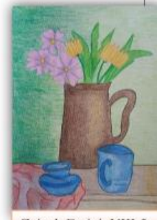
Zejneb Emiri, VIII-2