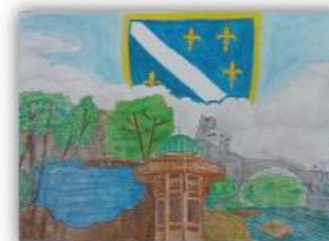
Fatma Goro, IX-1