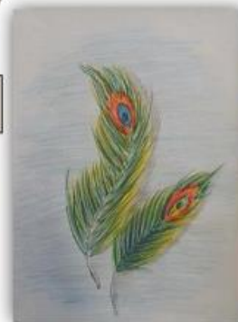
Una Omerhodžić, VI-1