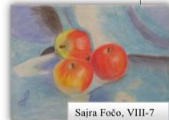
Sajra Fočo, VIII-7